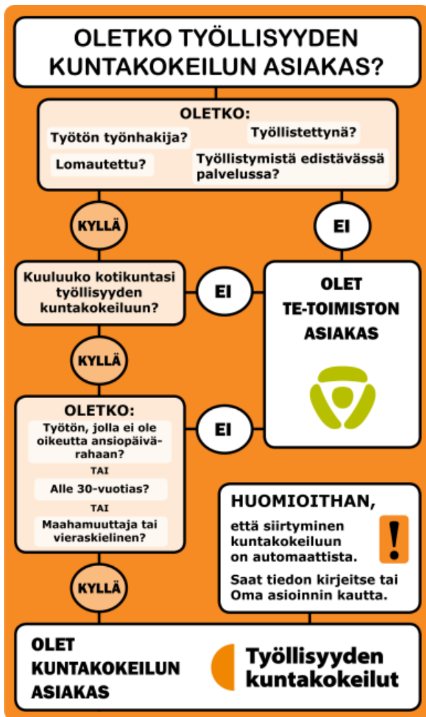
Kaavio 2. Oletko kuntakokeilun asiakas.

Pirkanmaan kokeilualueella maahanmuuttajien kotoutumisajan aikaiset TE-palvelut hoidetaan keskitetysti Tampereen kaupungin palvelutuotantona. Palvelut järjestetään asiakkaiden palvelutarpeen mukaisesti kotoutumisen eri vaiheissa. Kotoutumisaikaisten asiakkaiden keskitettyjä lakisääteisiä työllisyyspalveluita ovat työllistymissuunnitelmien, kuten kotoutumissuunnitelman laatiminen yhdessä asiakkaan kanssa, palvelutarpeen arviot, ohjaukset kotoutuskoulutuksiin ja palvelutarvetta vastaaviin palveluihin, lakisääteiset päätökset palkkatuesta, omaehtoisista opinnoista sekä muista tukimuodoista, päätökset työ- ja koulutuskokeiluista, ohjaukset työvoima- ja muihin koulutuksiin ja valmennuksiin sekä pyynnöt asiantuntija-arvioista. Kotoutumisaikaisen työnhakija-asiakkaan palveluprosessi hoidetaan kokonaisuutena Maahanmuuttajien osaamiskeskuksessa Tampereella huomioiden asiakkaan ja työllisyyspalveluiden lakisääteiset vastuut ja velvoitteet. Osaamiskeskus hyödyntää asiakaspalvelussa myös etäpalveluita ja jalkautuvia palveluita.