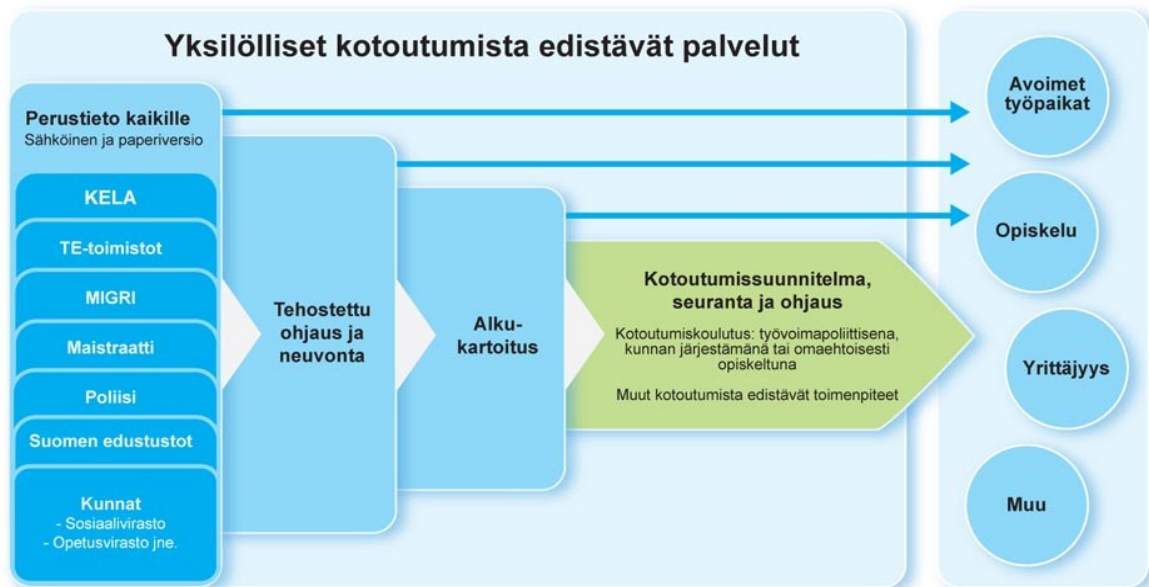
Kaavio 1. Yksilölliset kotoutumista edistävät palvelut.